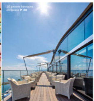
10 guides baroques en Suisse P. 30