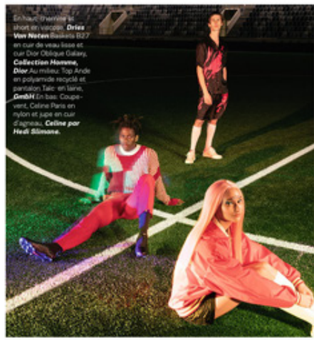
En haut: l'ensemble est short en viscose. Orles Vier Nieren (silk) D27 en cuir de vache lisse et cuir Noir Oniboue Galery. Collection Mamma . Dior Au milieu: Top Arde en polyamide recyclé et perles. Tote en laine. DonD En bas: Coupe- vent, Céline Paris en nylon et jupe en cuir Zigzagou . Celine par Heidi Slimane.