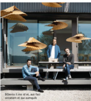
80 cents le mètre et, au feu occident et qui aumqu