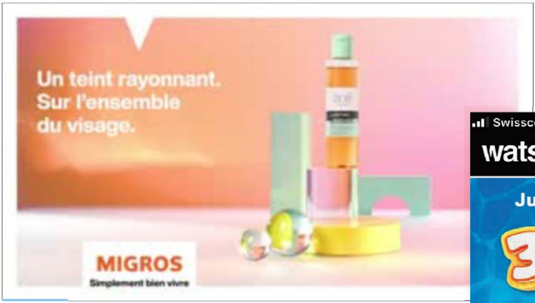
Blick romand [sic], 1 er juin 2021