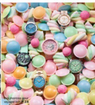
signatures pour voyagez les P. 28