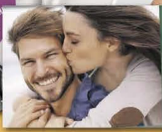
Cooperation, 8 mars 2018