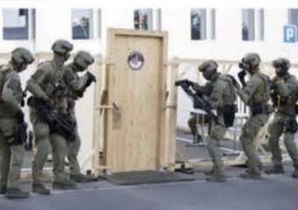
L'idée était de faire découvrir les activités de la police fribourgeoise au grand public.

Fribourg Les visiteurs ont pu découvrir la police fribourgeoise, samedi.