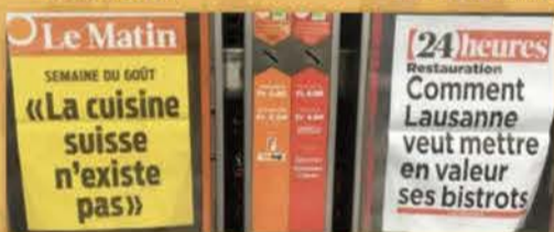
6 mars 2018