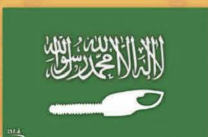
Dessin du Syrien Hossam al-Saadi repris par Le Temps , 20 octobre 2018

Les dessinateurs de presse de « Matin Dimanche » et de « 24 heures » victimes de plagiat par anticipation