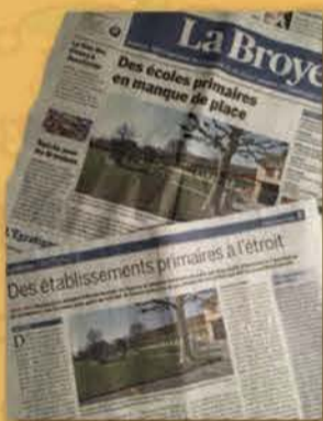
La Broye, 22 février 2018