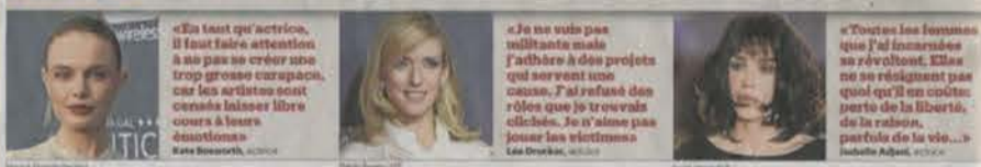
Le Malin Dimanche, 11 février 2018