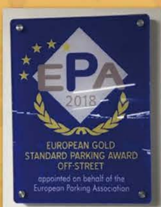
Parking de la gare de Berne, décembre 2018