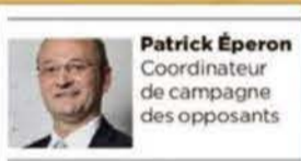
24 heures, 2 mars 2018