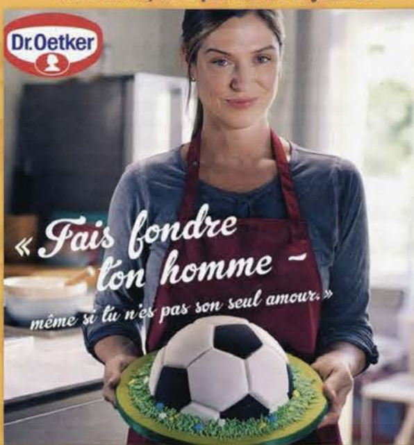
Barbecue, mai 2018, (Publié avec Coopération)

Vous n'achetez déjà pas les produits Dr.Oetker? Maintenant, vous pouvez les boycotter!