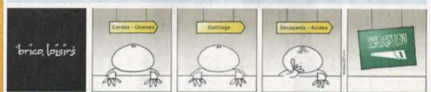
Le Matin Dimanche , 4 novembre 2018