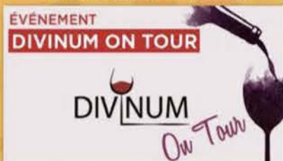
Pub dans 24 heures , 10 novembre 2018

Comment se ridiculiser en feignant d'être cultivé et branché