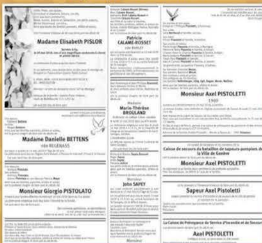
Tribune de Genève, 19 mai 2018

C'était fatal. À force d'ajouter des e pour féminiser les noms concernant les personnes, on va ajouter un e à tous les noms communs féminins