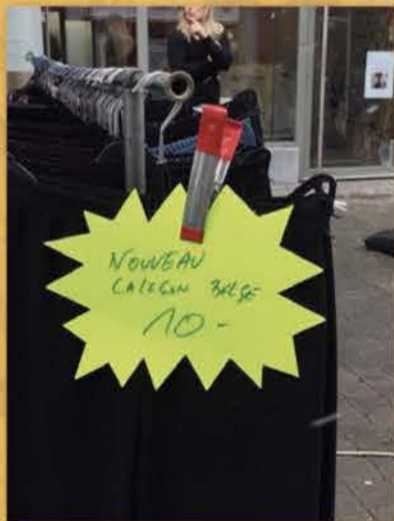
Nivelles (février 2017)