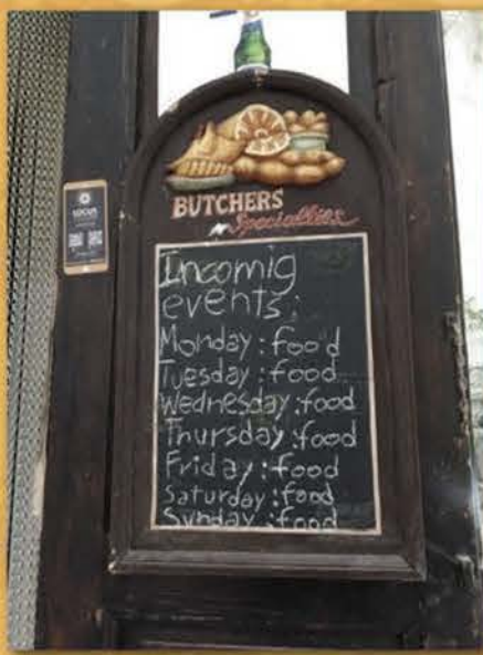
Locorotondo (coin des Pouilles)