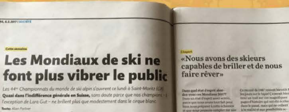
Migros Magazine, 6 février 2017