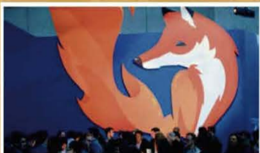
450 millions de terminaux ont installé le programme au panda roux. -02