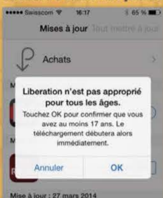
Mise à jour : 27 mars 2014

Les journaux en difficulté essaient d'attirer les jeunes