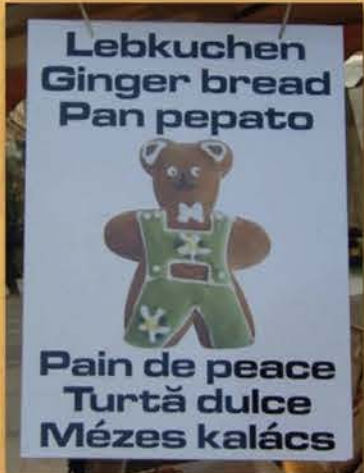
Photo prise au Marché de la place de l'Université à Satzborg le 6 juin 2014

L'info maniaco-dépressive mobile est arrivée !