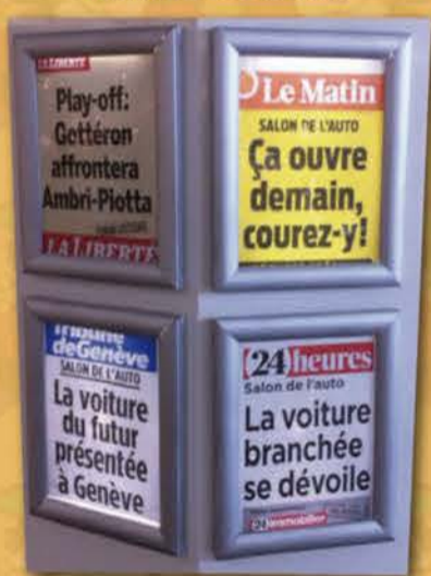
6 mars 2014