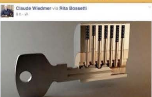
24 trucs que l'on aurait due apprendre à l'école Bon c'est pas très utile, mais quand même très intéressant !

Quand les Alémaniques essaient de répondre à nos besoins