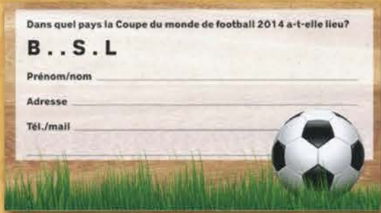
Jeu-concours Coop «Vive les grillades»