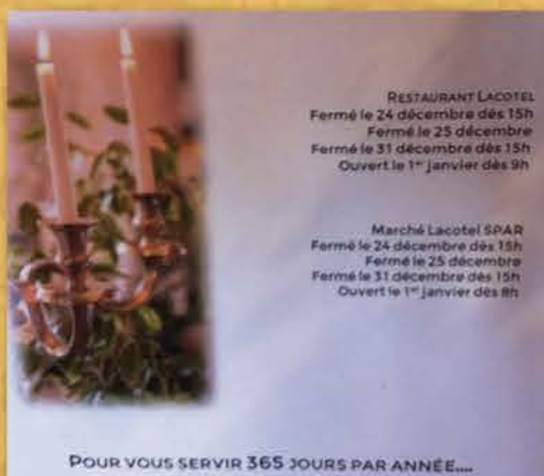
Avenches, décembre 2014