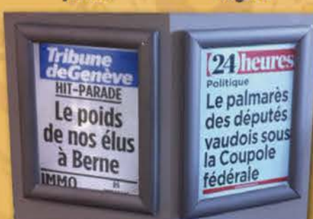
9 décembre 2014