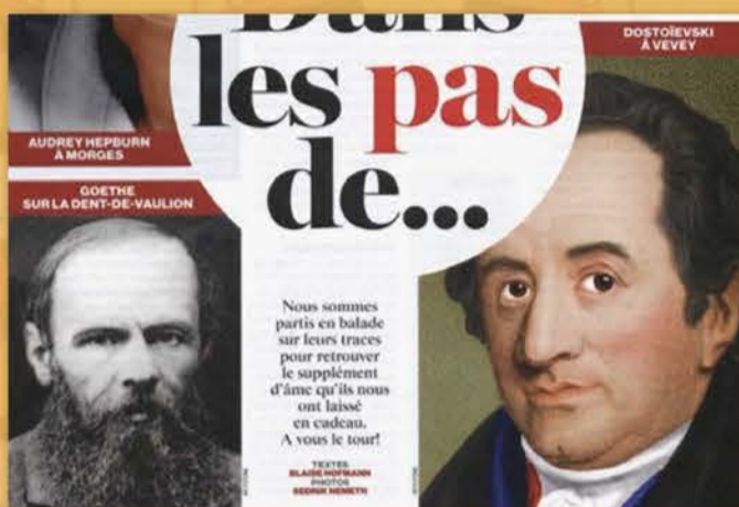
L'Hebdo, 3 juillet 2014

Une technique pour permettre aux lecteurs de se sentir malins en la répétant