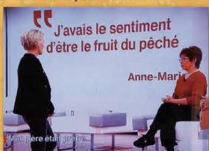
«Toute une histoire», RTS 1, 25 mars 2014

L'ORTHOGRAPHE PEUT FAIRE MAL Une coquille fait passer la fille du curé pour une morue