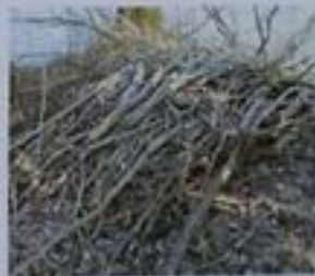
Stock de bois - Biberdamm

Principales règles de comportement dans le périmètre de protection Wichtigste Verhaltensregeln innerhalb des Schutzperimeters: