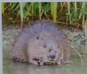
Castor commun de France - Biber gelbbraun

Hier lebt der Biber. Achten Sie daher insbesondere bei heftigem Wind oder starken Niederschlägen auf Bäume, die durch Biberverbiss geschwächt sind.