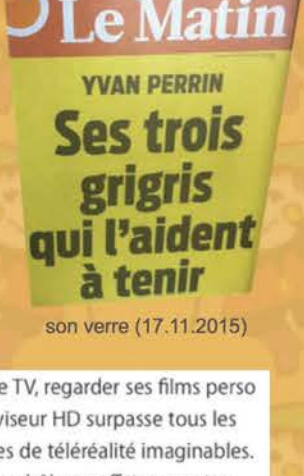
son verre (17.11.2015)

Le président de l'UDC de St. Margrethen avait écrit sur son blog qu'il est prouvé que les réfugiés d'Erythrée et de Syrie viennent de pays avec un très faible IQ (quotient intellectuel). Dire que les réfugiés de ces deux pays sont stupides n'est pas assez grave et ne suffit pas pour être reconnu coupable de discrimination raciale, a expliqué à l'ATS le greffier chargé du dossier. Avant d'ajouter: «D'ailleurs une condamnation donnerait trop d'importance aux propos de ce crétin.» (La Liberté, 07.11.2015)