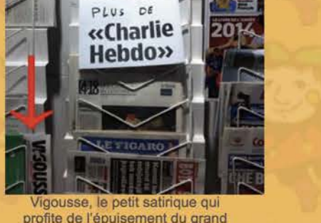
Vigousse, le petit satirique qui profite de l'épuisement du grand

surtout qu'on n'y trouve pas de Cénovin, de Rivella et de Parfait. (Le Matin Dimanche, 18.01.2015)